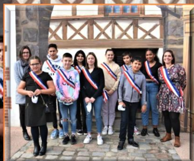
les jeunes élus du collège