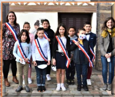
les enfants élus de l'école primaire