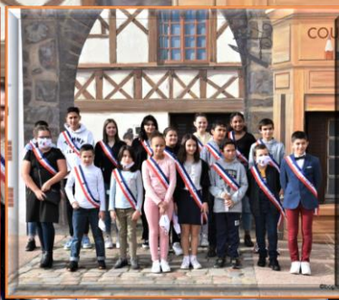
le conseil municipal enfants-jeunes